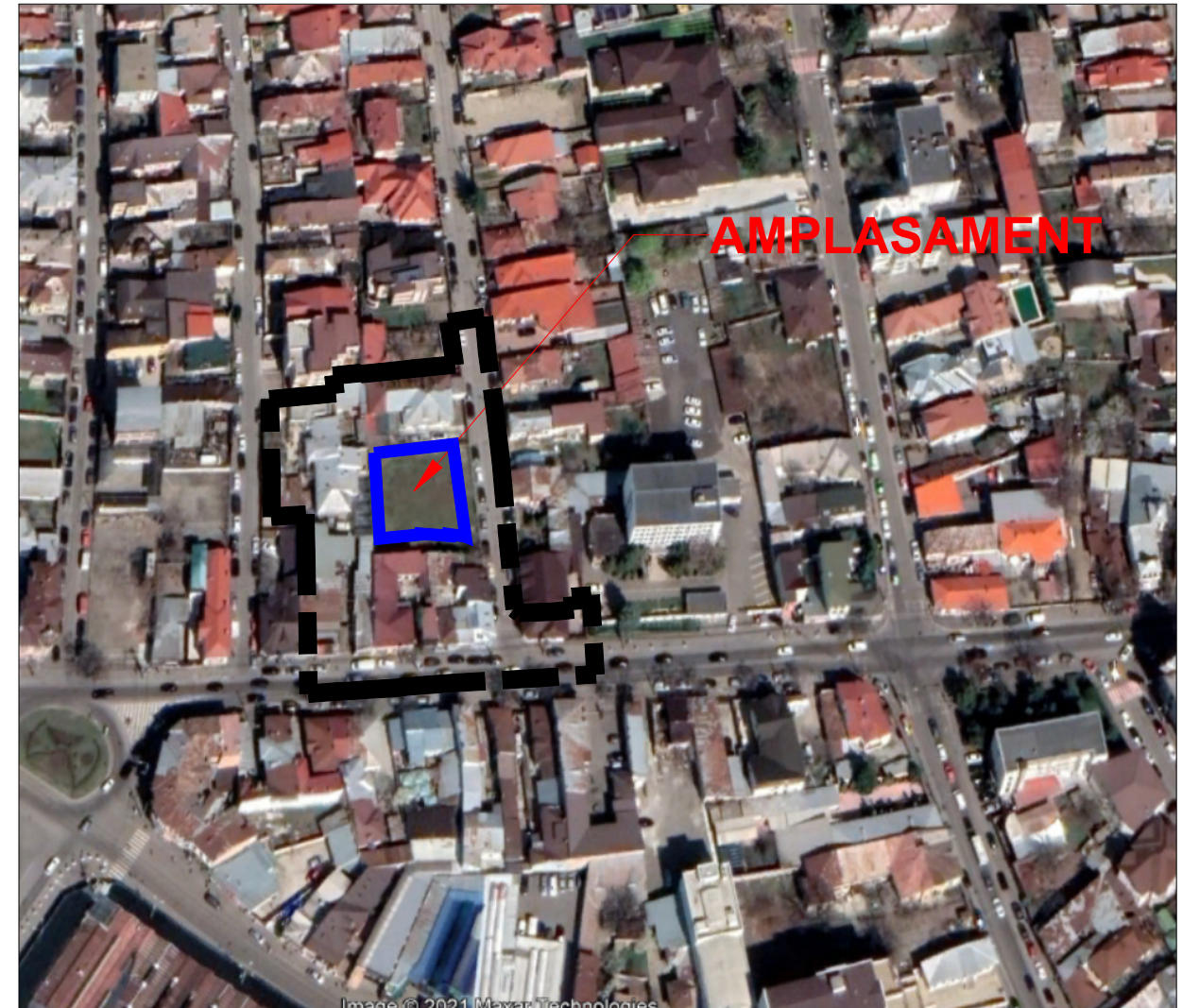
PLAN INCADRARE IN STATELIT sc 1:5000